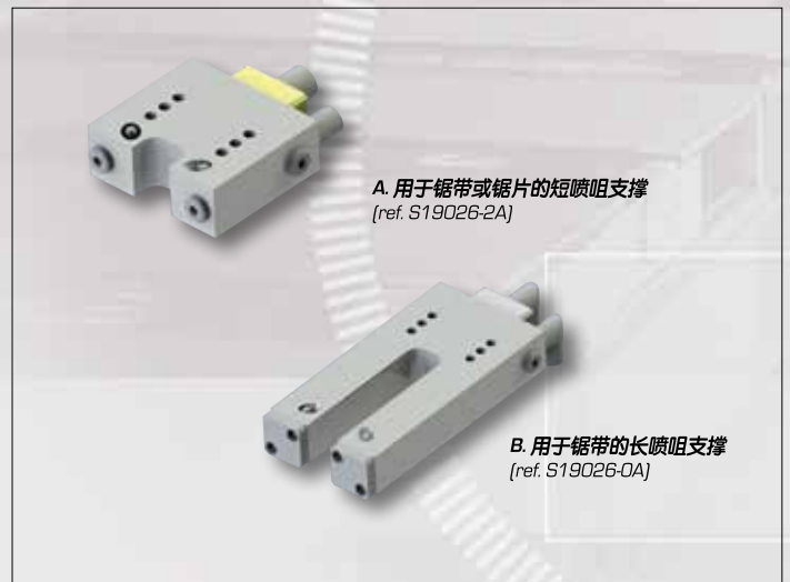
A. 用于锯带或锯片的短喷嘴支撑 (ref. S19026-2A)